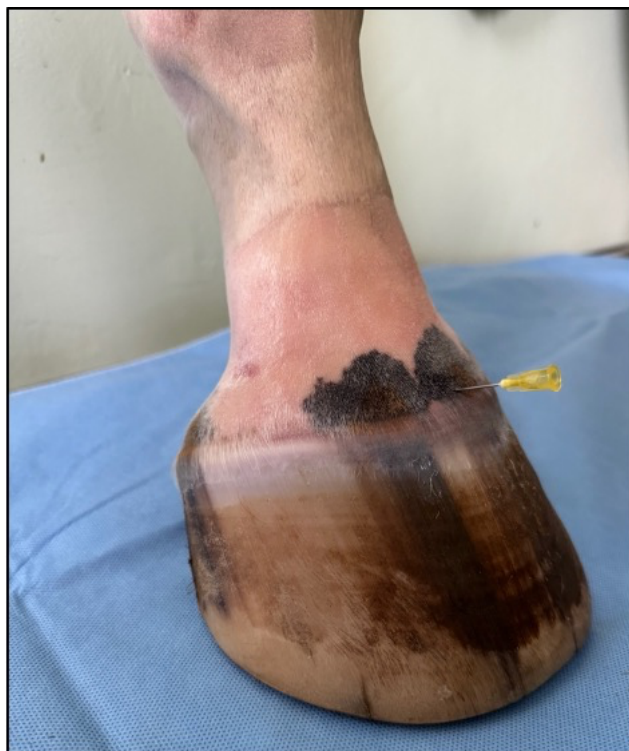
Detailní snímek zavedené jehly.