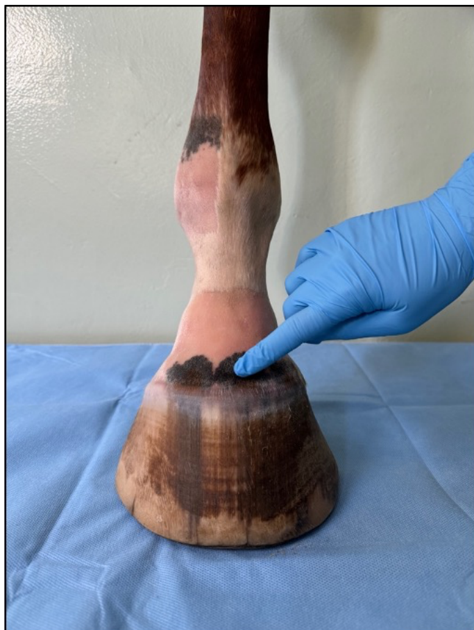
Ukázka místa vpichu jehly, 1 cm nad korunkovým okrajem.