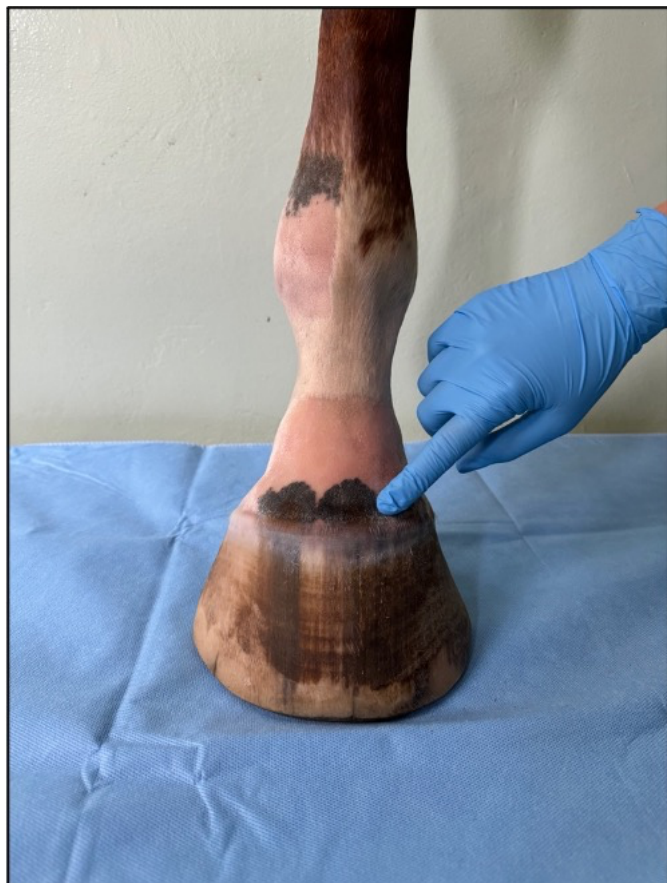
Ukázka místa vpichu jehly. 2,5 cm od mediální linie končetiny, u okraje šlachy dlouhého natahovače prstu.