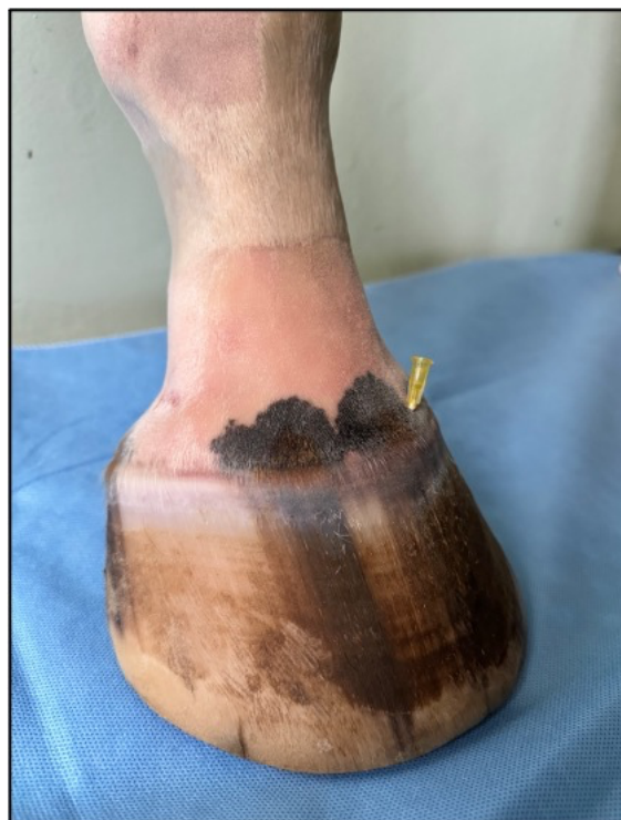
Detailní snímek zavedené jehly. Úhel jehly 45°.