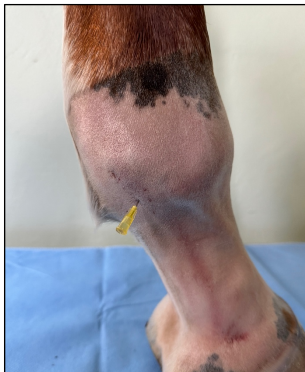
Detailní snímek zavedené jehly.