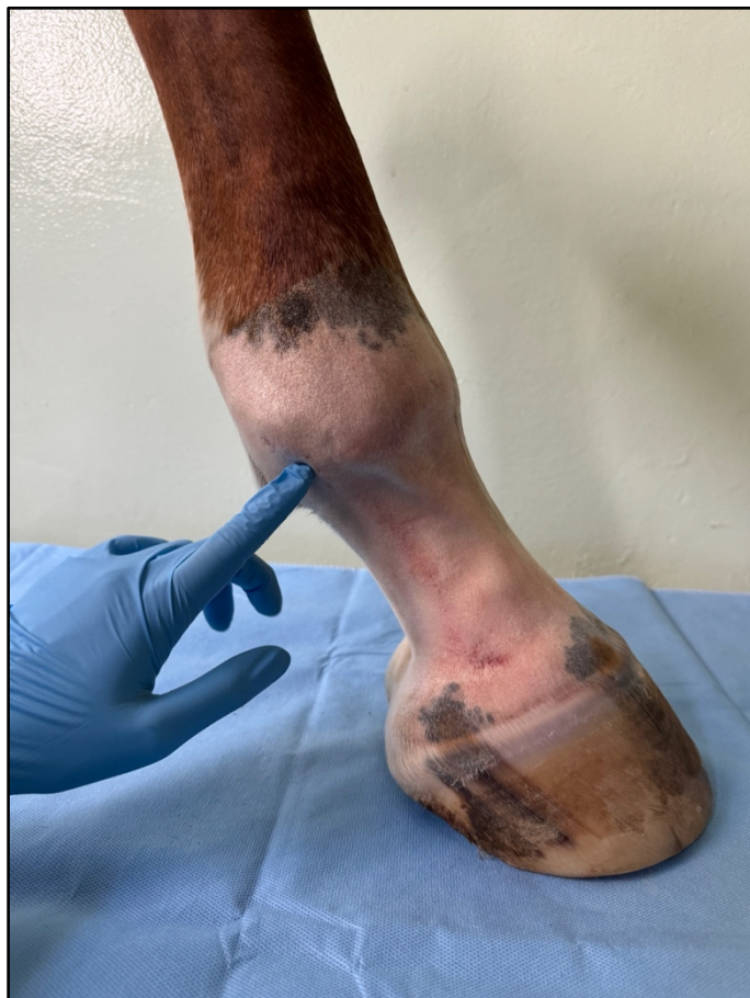
Ukázka místa vpichu. Pod distální okraj proximální sesamkové kosti, pod úhlem 45°.