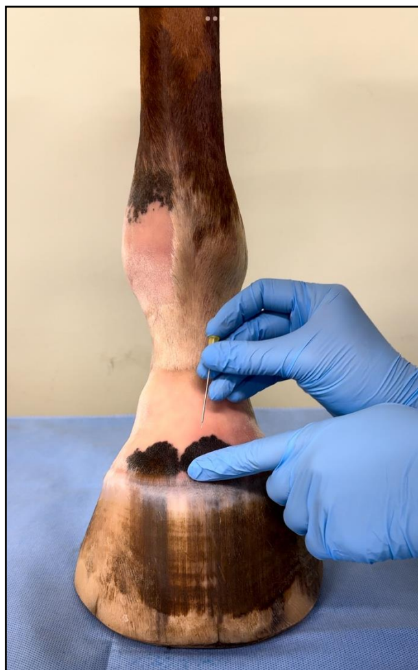
Ukázka místa vpichu jehly, 1 cm nad korunkovým okrajem a 1 cm mediálně či laterálně od mediální linie končetiny.