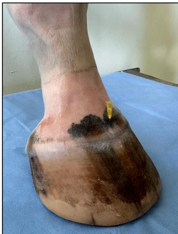
Detailní snímek zavedené jehly.