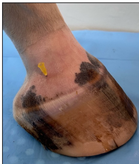
Detailní snímek zavedené jehly. Jehla směřuje v úhlu 45°, distálně.