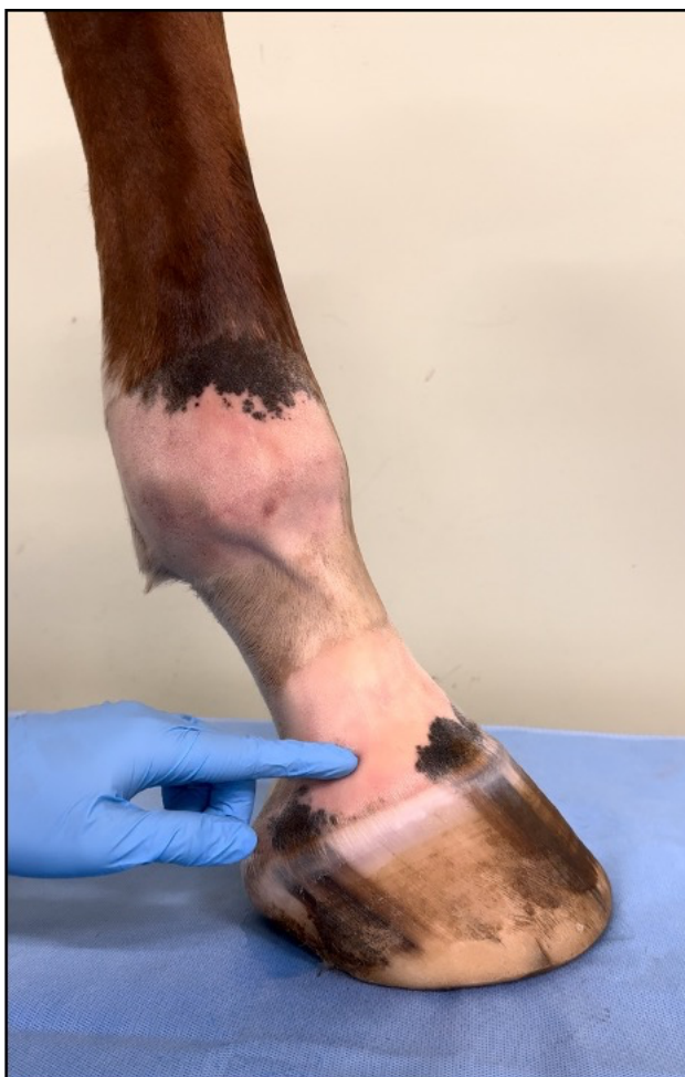
Ukázka místa vpichu jehly. Palpačně ohraničitelný proximální okraj kolaterální chrupavky kopytní kosti