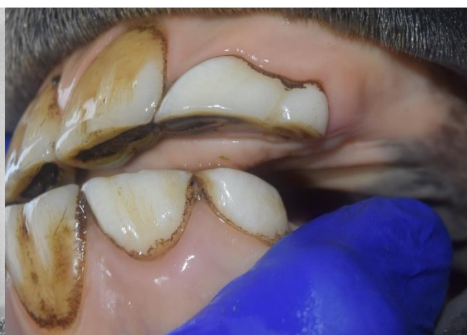
Obrázek 2 - 3 roky, deciduální zdvojený I2/I3